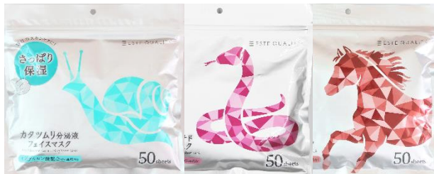
カタツムリ分泌液／毒蛇ペプチド／馬油