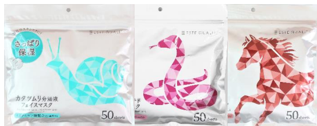
カタツムリ分泌液／毒蛇ペプチド／馬油