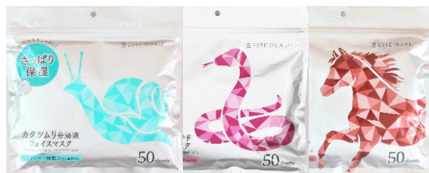
カツムリ分泌液／毒蛇ペプチド／馬油