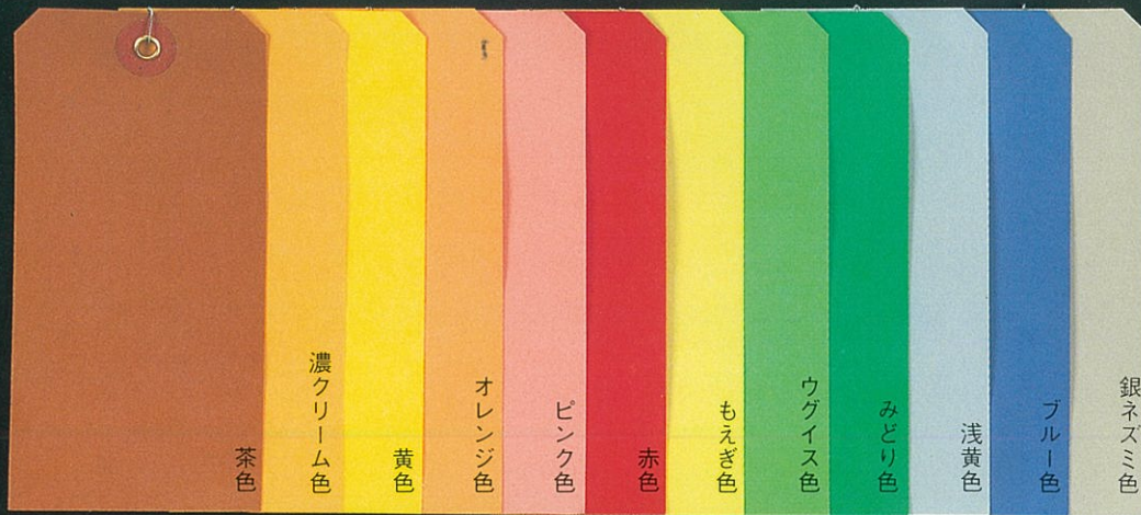
⑥ カラー布荷札大 60×120mm