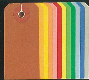
⑨ カラー布荷札豆 30×65mm