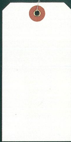
① 白布荷札大 60×120mm