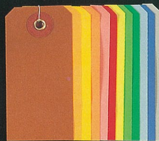
⑧ カラー布荷札小 35×72mm